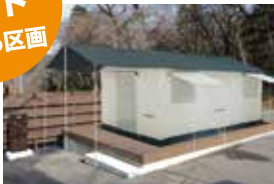
常設テントサイト