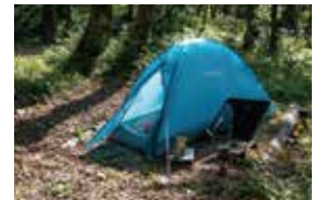
グラウンドサイト