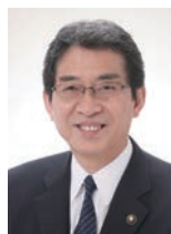
副大会長(舞鶴市長) 多々見 良三

ようこそ福知山市へ。山のステージの舞台となる大江山は、古来より和歌に詠まれ、さらには酒呑童子をはじめとする数々の鬼伝説に彩られた山です。清流「二瀬川」や温暖帯性と冷温帯性の植物群が交じり合う豊富な植物相など、変化に富んだ大江山の自然とゴール地点「千丈ヶ嶽」から見渡す絶景をぜひご堪能ください。