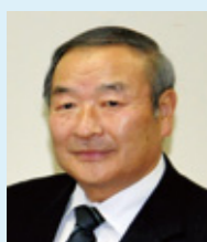
飯山市長職務代理者 飯山市副市長 月岡 寿男

結びに、本大会の開催にあたり御協力をいただきました関係者の皆様に深く感謝申し上げますとともに、大会の成功を祈念し、歓迎の御挨拶いたします。